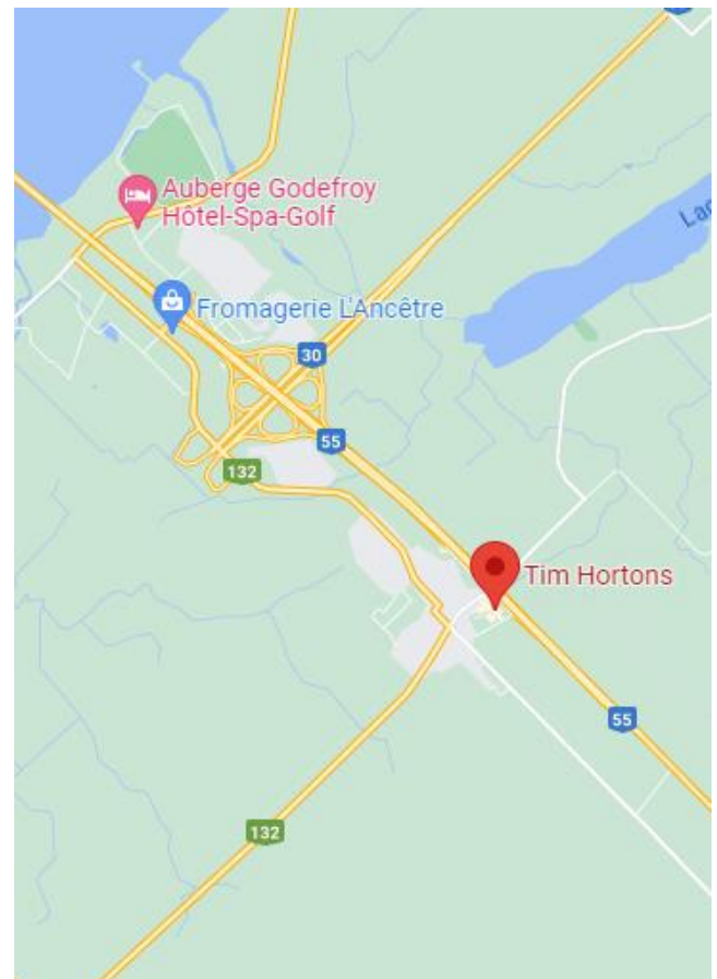
Tim Hortons de St-Grégoire